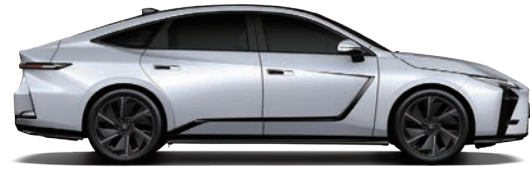
LFA 白 (083)