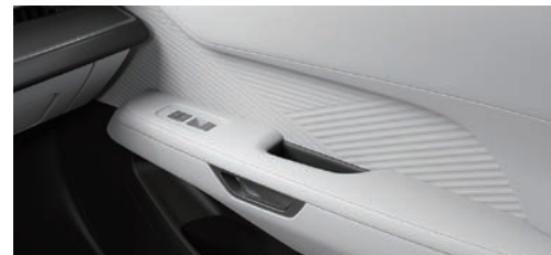
弦影雷雕飾板 (頂級版、豪華版專屬)