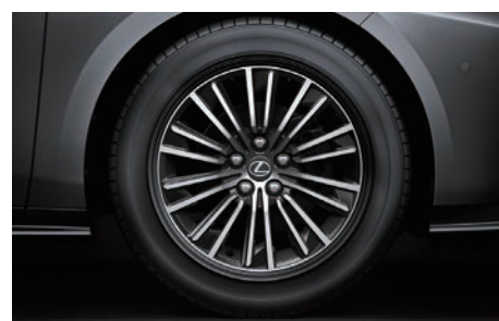
18 吋多幅式鋁圈 (ES 300h 車型專屬)