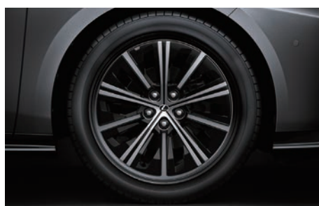
19 吋鋁圈附 AERO 輪圈蓋 (ES 500e 頂級版專屬)