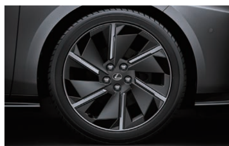
21 吋鋁圈附 AERO 輪圈蓋 (ES 500e 旗艦版專屬)