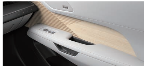
竹韻光雕飾板 (ES 500e 旗艦版專屬)