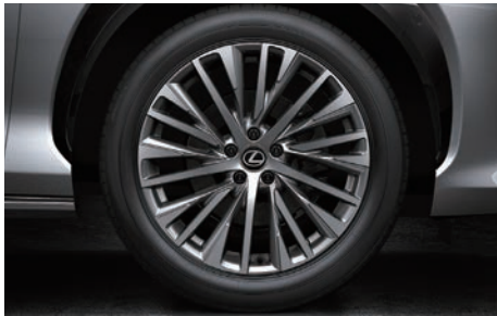
20 吋多幅式鋁圈 ( RZ 500e 旗艦版專屬 )