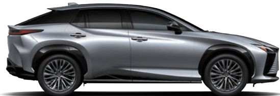
星塵銀 ( 1L2 )