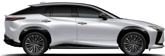
雪曜白 ( 090 )