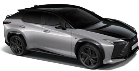
銀耀灰、爵色黑雙色 (M48) (RZ 550e F SPORT 版專屬)