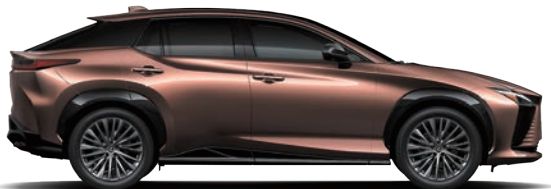
光焰銅 ( 4Y5 ) ( RZ 500e 旗艦版、豪華版專屬 )