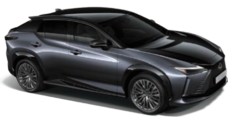
星耀灰、爵色黑雙色 (2YH)