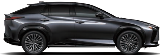
星耀灰 ( 1L1 )