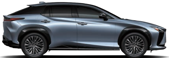
冰河藍 ( 8Z2 ) ( RZ 500e 旗艦版、豪華版專屬 )