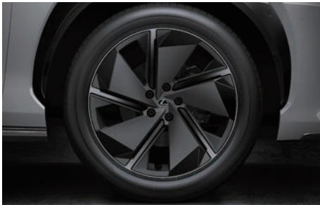
20 吋鋁圈附 AERO 輪圈蓋 ( RZ 550e F SPORT 版專屬 )