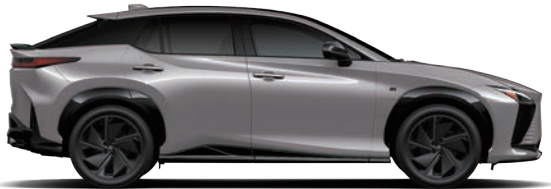
銀曜灰 ( 1N0 ) ( RZ 550e F SPORT 版專屬 )