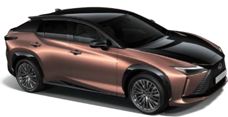
光焰銅、爵色黑雙色 (2YF)