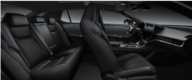
幕夜灰、尊爵黑雙色

RZ 550e F SPORT 版專屬 (Ultrasuede® 人造麂皮 + F SPORT 豪華真皮)