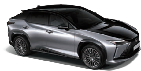
星塵銀、爵色黑雙色 (M53)