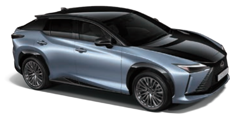
冰河藍、爵色黑雙色 (2YG) (RZ 500e 旗艦版、豪華版專屬)