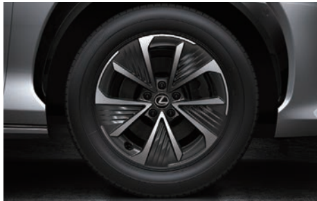
18 吋銳切雙色鋁圈 ( RZ 500e 豪華版專屬 )

RZ 550e F SPORT 版專屬 ( Ultrasuede® 人造麂皮 + F SPORT 豪華真皮 )