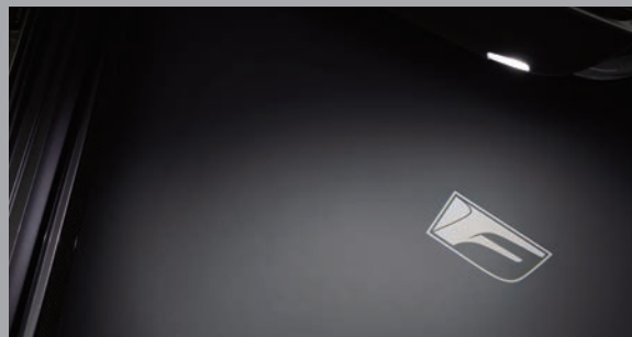
Final Edition 專屬車門迎賓燈