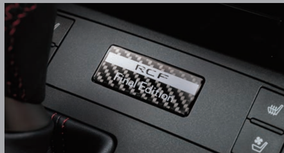
Final Edition 專屬銘牌