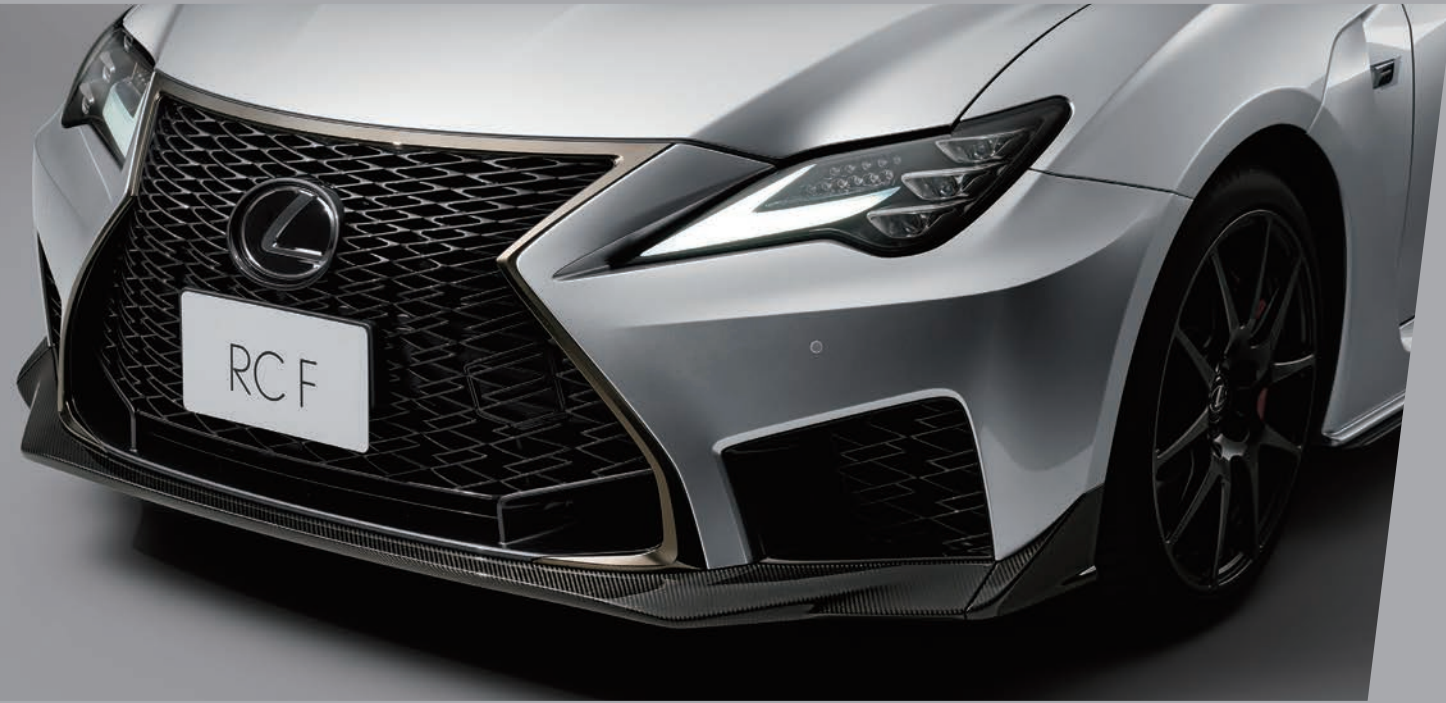
碳纖維前下導流器