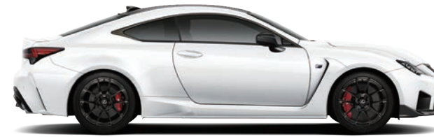
LFA 白 (083)