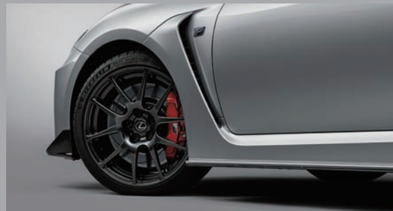
19 吋 BBS 鍛造鋁圈 (附紅色煞車卡鉗)