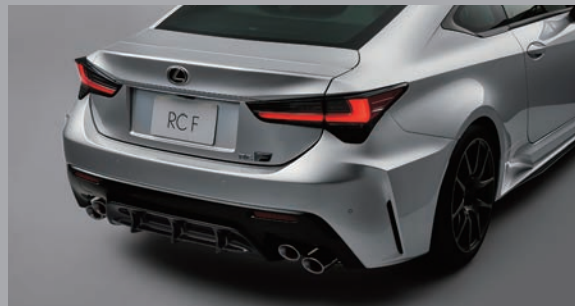
碳纖維車頂、側導流器及後下導流器