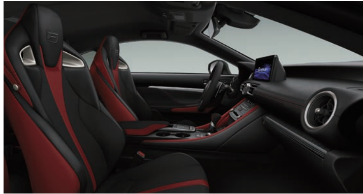
烈焰紅、尊爵黑雙色

■ 外觀色、飾板色、內裝色顏色細節依車型版本略有不同，請以實車為準，詳情請洽全台各經銷商；本示意圖僅供顏色參考，各車型版本配備請詳閱車型設定表。 ■ 內裝示意圖僅供參考，可能與實際顏色、材質等細節有所差異，請以實車為主。